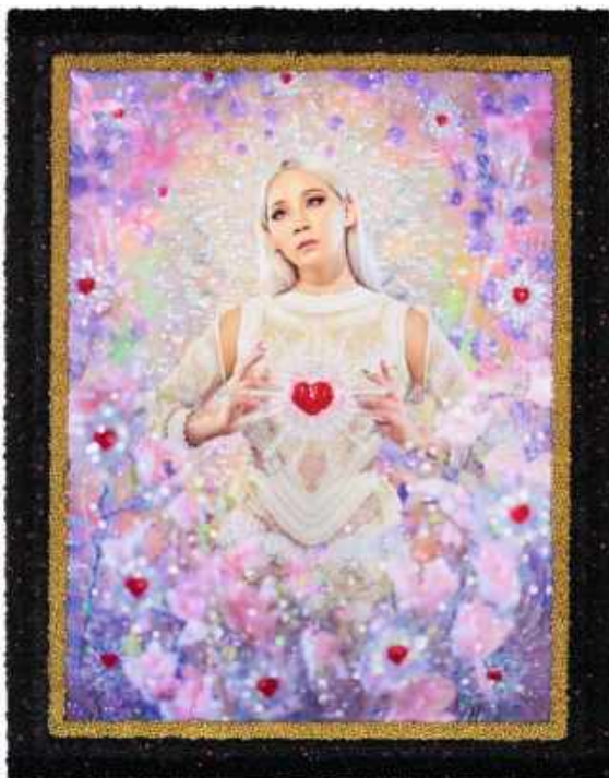
Coeur Magique , 2016 [Chaelin CL]

Parallèlement, très empreints de l'iconographie et des structures de l'art classique, les deux artistes s'inscrivent dans la lignée de l'histoire du portrait occidental . À l'époque où les saintes icônes ont fait place aux idoles de la chanson et où la mystique des chants grégoriens a été remplacée par l'agitation des concerts de rock , Pierre et Gilles n'en introduisent pas moins le sacré dans leur iconographie, en réalisant des portraits presque magiques et miraculeux, où les images ont une vie propre et sont vénérables en tant que telles.