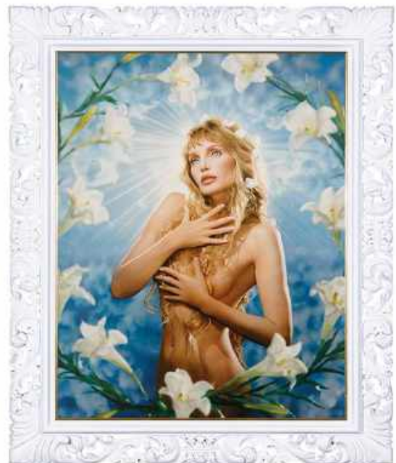
Extase, 2002 [Arielle Dombasle]