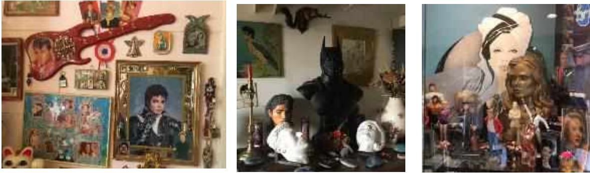
Vues de l'atelier de Pierre et Gilles

Portée par la nature quasi-mystique de l'œuvre de Pierre et Gilles, l'ambition scénographique du projet s'inscrit dans la continuité formelle et esthétique de l'imaginaire du duo. Centrée sur la notion d'idole, dans son sens religieux, elle a vocation à souligner les mises en scène et l'iconographie utilisée par les deux artistes.