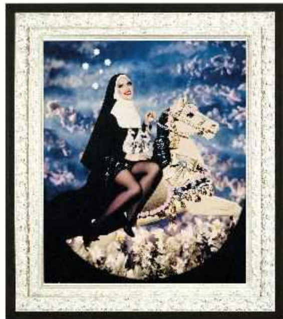
Sainte Mary MacKillop, 1995 [Kylie Minogue]