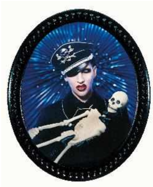
The Dead Song, 2004 [Marilyn Monson]

La scénographie porte une attention toute particulière à la structure du son dans l'architecture, comme c'est le cas dans les principes architecturaux des lieux de culte. La musique des « idoles » est diffusée sous chaque photographie-peinture exposée, au moyen d'un juke-box. Le visiteur peut ainsi découvrir un titre différent par œuvre au moyen d'écouteurs, de manière immerger ce dernier dans un espace visuel et sonore individuel.