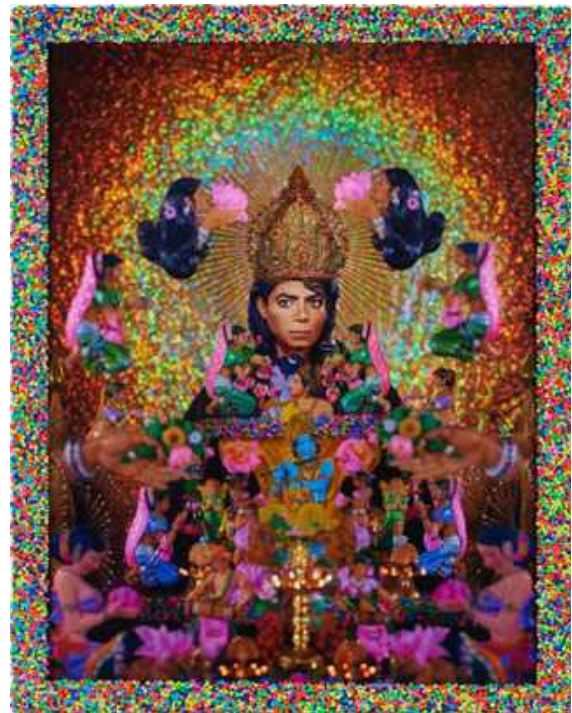
Loving you, Hommage à Michael Jackson , 2017